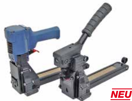
NEU Deckelhefter MEPA 18 / MEPA 18 P MEPA 22 / MEPA 22 P