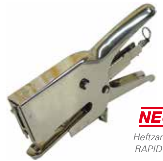
NEU Heftzange RAPID 31