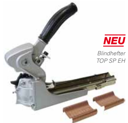
NEU Blindhefter TOP SP EH