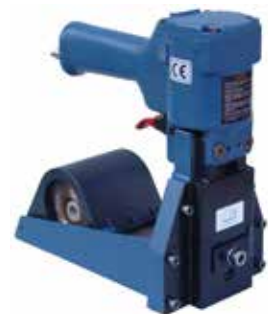
NEU Rollenhefter MERO 18 P / MERO 22 P